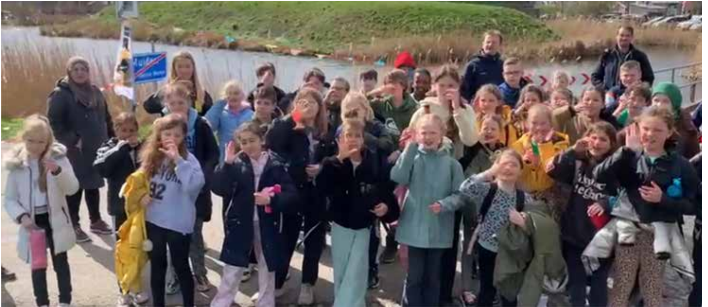
FOTO 260 KINDEREN WANDELEN VOOR WATER...