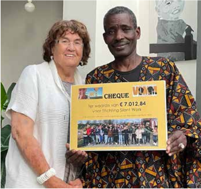
FOTO CHEQUE EN

Natuurlijk bedanken wij alle betrokkenen van Silent Work, maar ik wil u dit niet onthouden: