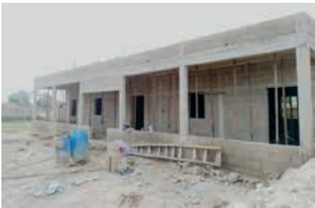
De Bouw van de 11e basisschool

Een meisje van 13 heeft een kunstbeen gekregen, een man van 35 krijgt er in deze periode ook een. De man die diabetes bleek te hebben waardoor zijn voet maar niet wilde genezen en daarom geamputeerd zou moeten worden: hij is van Mauritanië naar Senegal gebracht. De diabetes is onder controle gebracht met insuline voor de prikpen. Hij heeft geleerd dit zelf goed te regelen. Drie tenen moesten geamputeerd worden, maar zijn genezen. Hij loopt op een aangepaste schoen. Hij geeft leiding aan een groot landbouwproject (met hulp van SW gestart) in zijn geboortedorp. Een project dat werk en inkomen biedt aan 60 vrouwen.