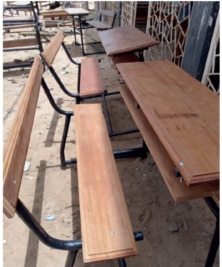
zo moet het eruit gaan zien.