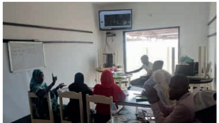
de training langue colorée en gebaren training. voor alle leerkrachten