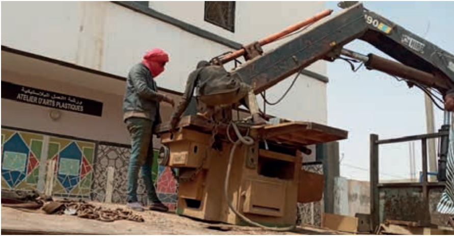
het op zijn plaatsbrengen en hijsen van de zware houtbewerkings machine.

Er wordt een presentatiescherm gemaakt van de activiteiten, dat iedere morgen buiten voor de open deuren wordt geplaatst.