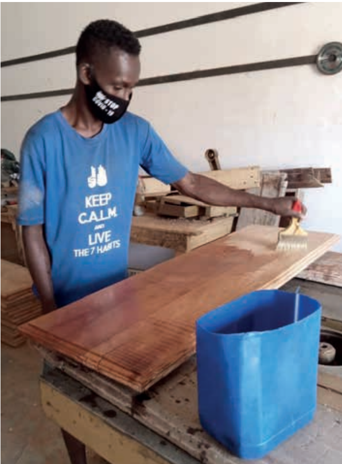
het repareren van schoolbanken!!