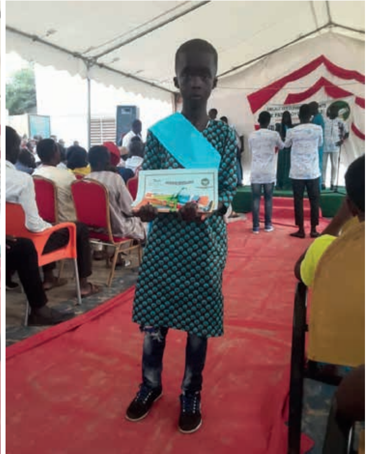
samen met het meisje deed dit joch ook het toelatingsexamen en slaagde