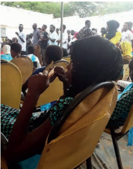
het feest voor het dove meisje dat de beste punten voor de toelating naar het vervolg onderwijs. in Fass Boye en omgeving