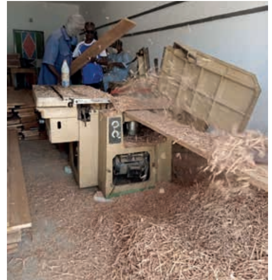
de zaagmachine in gebruik!!