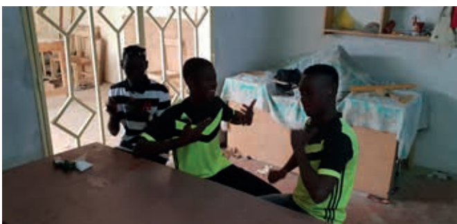
Deze jongens gaan werken in de meubelmakerij van Centre Commercial des Sourds.

De onderwijsinstelling bovenop het Centre Commercial is ook klaar. Daardoor is het schilderen van het hele pand binnen en buiten gestart.