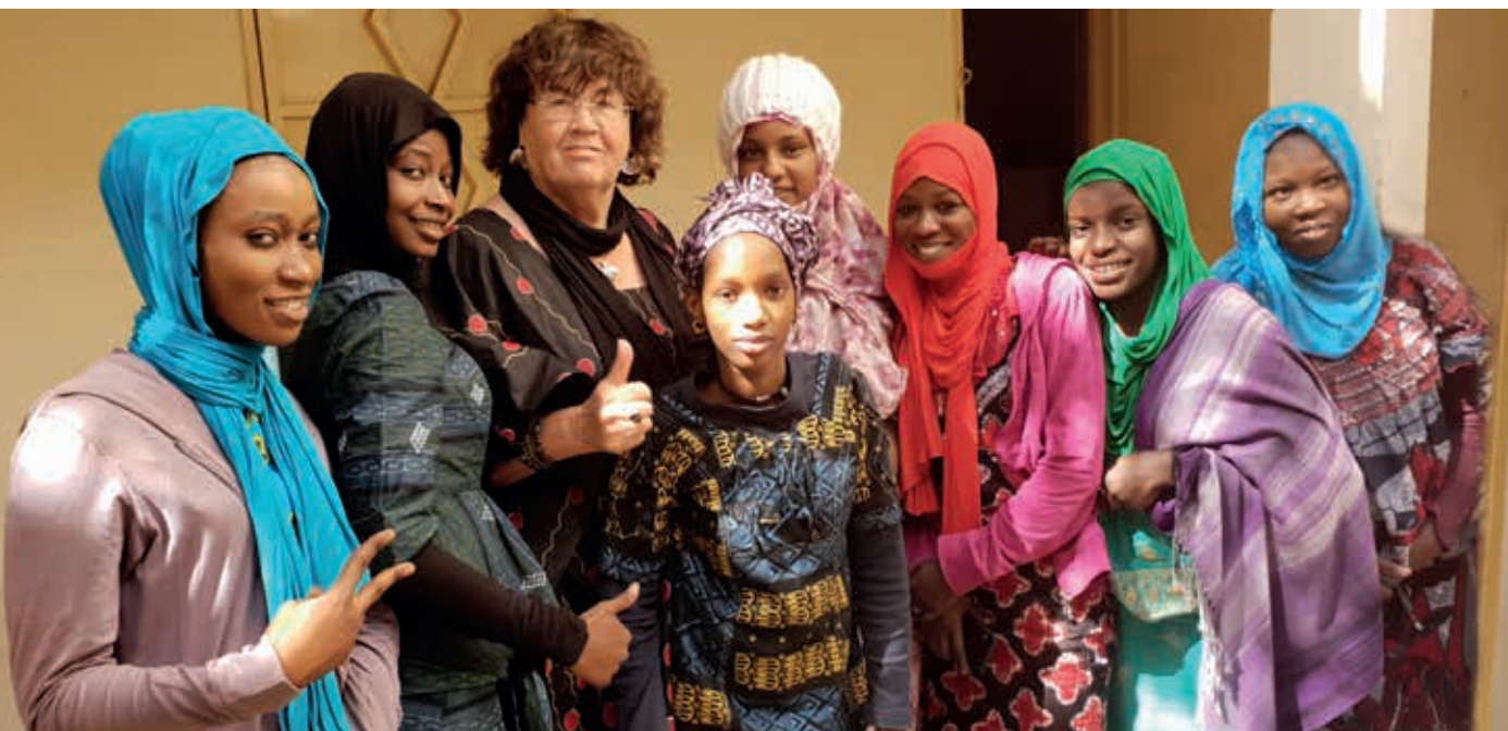
De meisjes van het atelier couture in Centra Commercial.