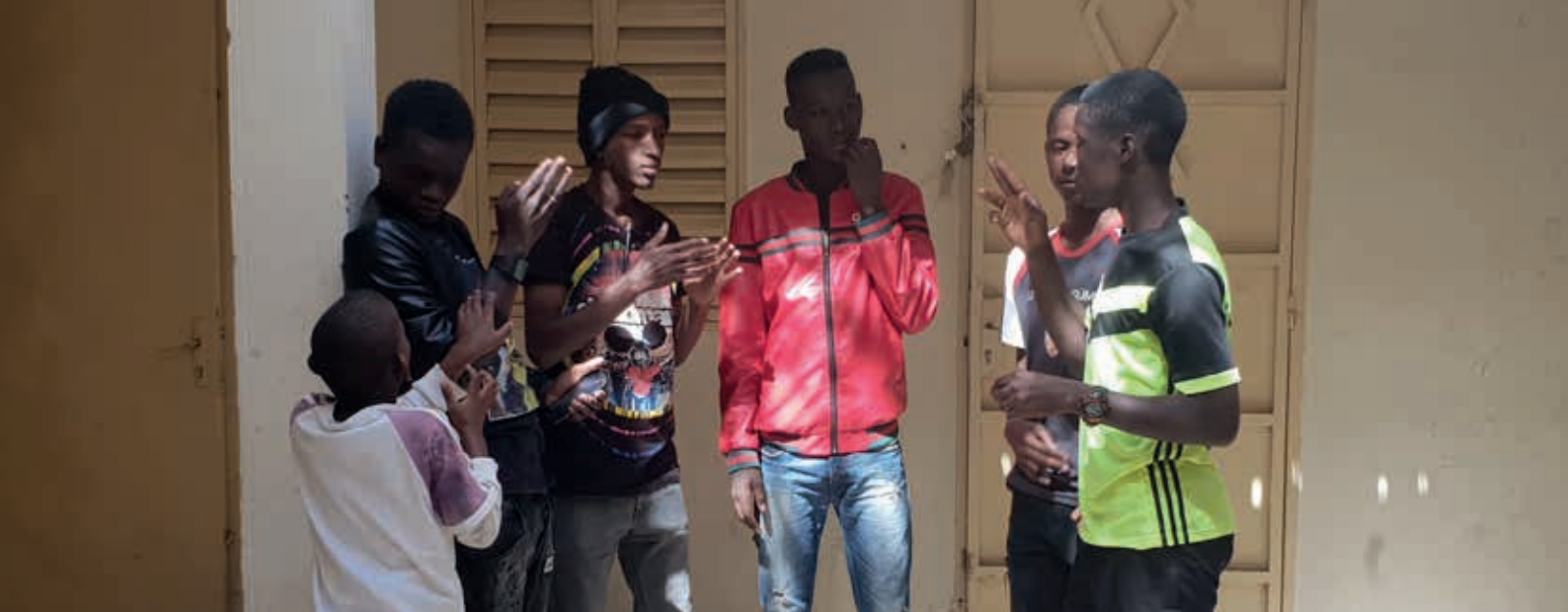
Deze jongens praten over hun baan bij centra commercial in juni