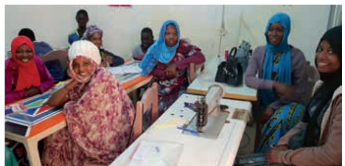
Deze meisjes gaan stagelopen/werken in het atelier couture in Centra Commercial.