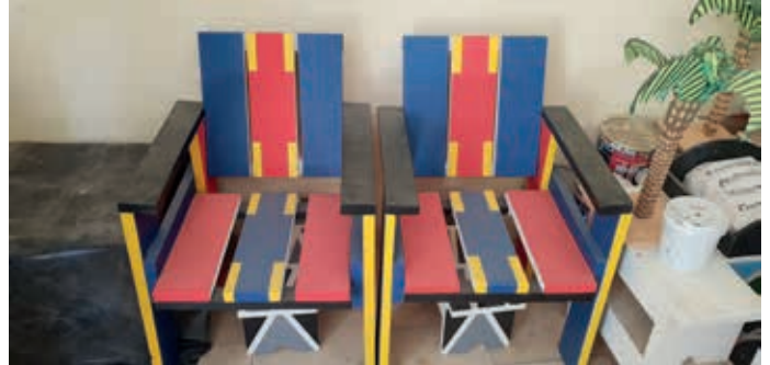
Stoelen voor het kantoor in centre commercial. Evenals een grote kast, een bureau en een groot schilderij in dezelfde stijl. Alles wordt gemaakt door de studenten van Maison des Sourds.

Ook over de meubelmakerij, de kleermakerij en het restaurant zullen dove ondernemers de leiding krijgen die hun opleiding en diploma gehaald hebben bij Maison des Sourds. Voor de bakkerij wordt om te beginnen gezocht naar een ervaren broodbakker die de leiding krijgt over het bedrijf waarin alleen dove jongeren zullen werken.