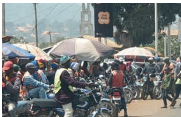
Even een brommertje pakken???