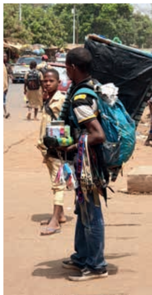
een van onze ongenode medereizigers