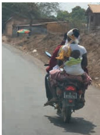
Hoeveel kunnen er op 1 brommer??