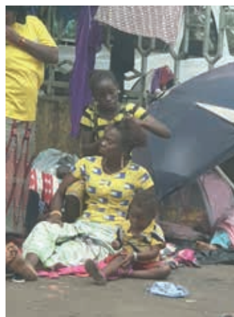
Blijf van mijn lijfhuis gewoon op straat.