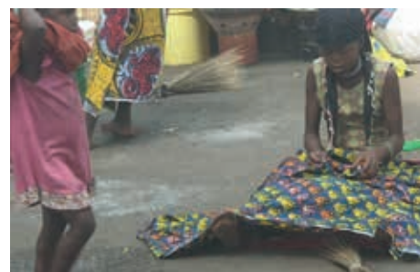
Blijf van mijn lijfhuis gewoon op straat.