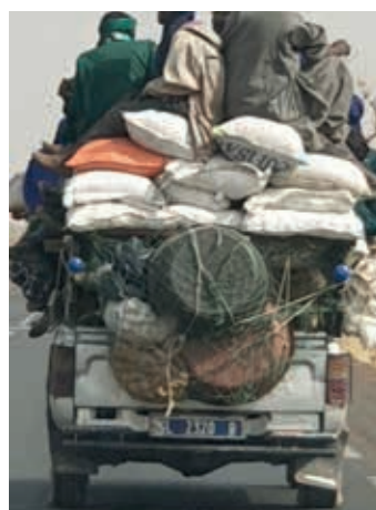
Een wagen vol geladen