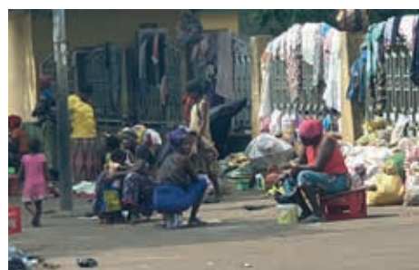
Blijf van mijn lijfhuis gewoon op straat.