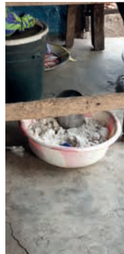
beetje zout erbij