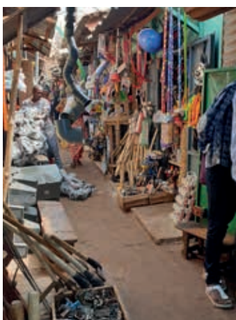
Kalverstraat in Conakry