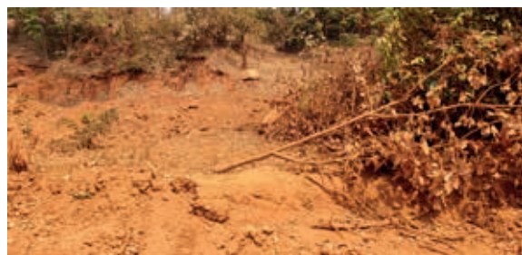
Waar is de weg?

Langzaam komen we tot de ontdekking dat de reis minstens vier en waarschijnlijk wel vijf dagen in beslag zal nemen. De auto krijgt een grote beurt, er worden extra meerdehands reservewielen gekocht, er wordt een zware vangrail voor op de auto gelast en jerrycans voor water en diesel geleend.