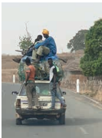
Hoeveel kunnen er op 1 auto???