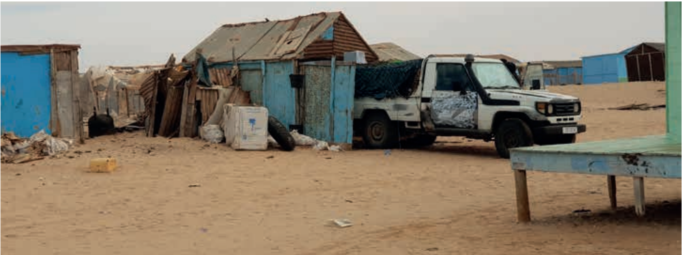
Nouakchott covid19 2020.

Vanmorgen werden we opgeschrikt door een bericht over het coronanieuws in Mauritanië. Er was sinds lange tijd een uitzending van het ministerie van gezondheid over Covid-19 in Mauritanië. Er werd gesproken over honderden zieken en vele doden door corona. Bij gebrek aan testmaterialen of andere manieren om corona te herkennen en te genezen zijn de besmettingen opgelopen. Het land heeft maar 3.500.000 inwoners en ongeveer de helft daarvan woont in de Sahara, waar corona nog niet ontdekt is. Men sprak van honderden of duizenden meer gevallen van ziekte en overlijden, omdat er geen controle mogelijk is. De mensen die overlijden worden binnen een paar uur begraven, zeker als men vermoedt dat besmetting mogelijk is. Alle scholen, dus ook de acht scholen voor doven (gebouwd en georganiseerd door Silent Work), zijn dicht. Ook Centre Commercial des Sourds is gesloten. Men hoopt hiermee controle te krijgen over de uitbraak van het virus. Fijn is dat er geen ziekte- of sterfgevallen zijn onder de vele doven, de leerkrachten en andere medewerkers. Men blijft alert en voorzichtig.