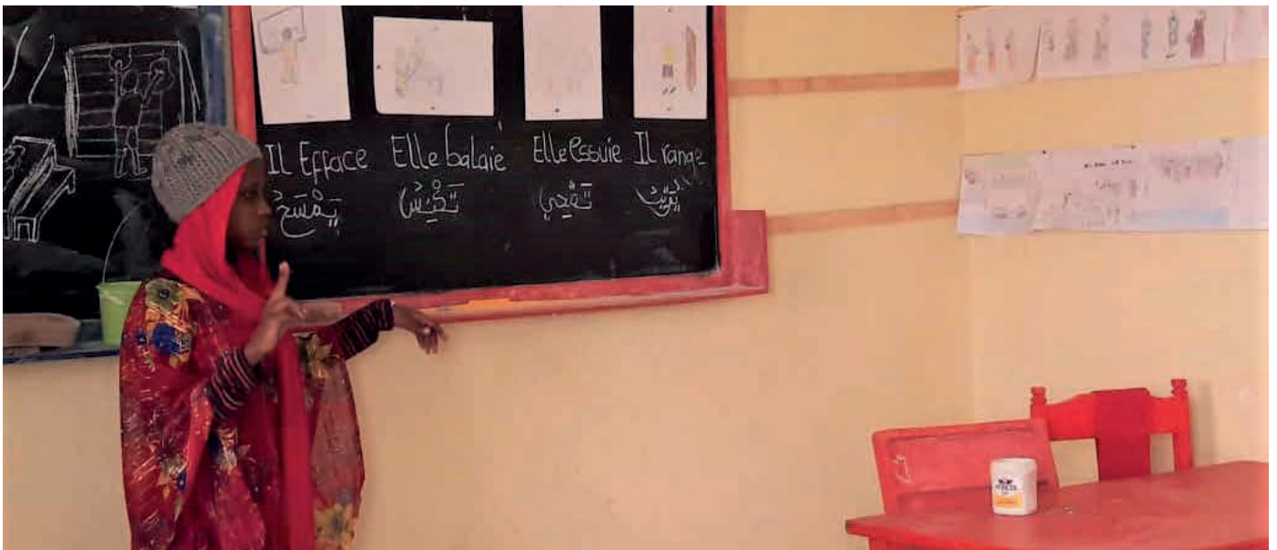
Naast gebarentaal en Frans moeten ook de dove kinderen zich de Arabische taal eigen maken. En dat is geen eenvoudige opgave.

Vanmorgen werden we opgeschrikt door een bericht over het coronanieuws in Mauritanië. Er was sinds lange tijd een uitzending van het ministerie van gezondheid over Covid-19 in Mauritanië. Er werd gesproken over honderden zieken en vele doden door corona. Bij gebrek aan testmaterialen of andere manieren om corona te herkennen en te genezen zijn de besmettingen opgelopen. Het land heeft maar 3.500.000 inwoners en ongeveer de helft daarvan woont in de Sahara, waar corona nog niet ontdekt is. Men sprak van honderden of duizenden meer gevallen van ziekte en overlijden, omdat er geen controle mogelijk is. De mensen die overlijden worden binnen een paar uur begraven, zeker als men vermoedt dat besmetting mogelijk is. Alle scholen, dus ook de acht scholen voor doven (gebouwd en georganiseerd door Silent Work), zijn dicht. Ook Centre Commercial des Sourds is gesloten. Men hoopt hiermee controle te krijgen over de uitbraak van het virus. Fijn is dat er geen ziekte- of sterfgevallen zijn onder de vele doven, de leerkrachten en andere medewerkers. Men blijft alert en voorzichtig.