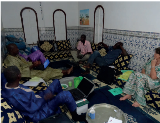
wat lijkt het relext, zo zonder stoelen en tafels.