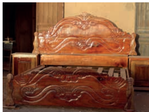
een aandachtvragend ledikant!!!

Ons dilemma is nu kiezen voor een zak met snippers of een lege zak. Slapen doen we, hoe dan ook.