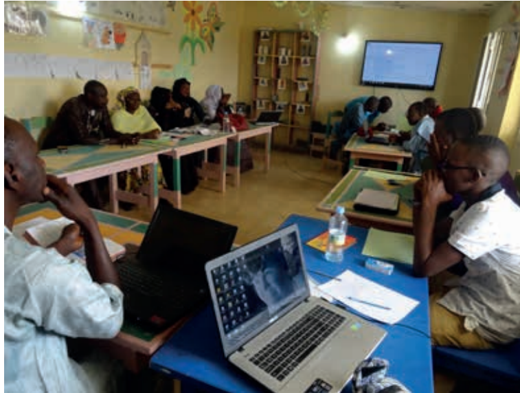
Zo graag wil ik naar school!

Ik laat hem het pasje zien en vertel hem dat het niet geldig is, omdat mijn naam en gegevens erop staan. Hij antwoordt laconiek: 'maakt niet uit, ik kan toch niet lezen.' Hij is niet te overtuigen dat deze pas ongeldig is. Als definitief besluit geeft hij aan: 'mevrouw, u kent Mauritanië niet.' Stiekem denk ik: was dat maar waar. Soms verlang ik naar mijn argeloosheid van de eerste jaren.