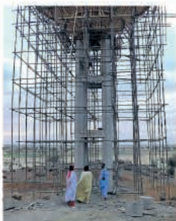
Dynamis tijdens de bouw van de waterfontein.