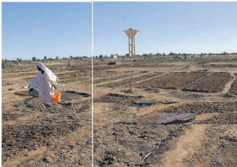
Start van landbouwproject aan de rand