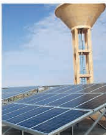
Zonnepanelen bij de waterpomp dynamis.