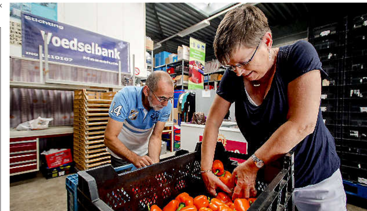
Vrijwilligers sorteren kilo's paprika's bij de voedselbank.