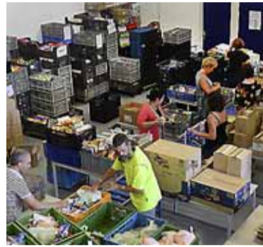
De voedselbank in Hoofddorp.

Ook andere voedselbanken zegen nimmer boycotproducten te hebben ontvangen. In Haarlem is sowieso het aanbod nihil laat een woordvoerder weten. Daar wordt meer ingezet op lang houdbare producten. In Haarlemmermeer levert de voedselbank wel voldoende pakketten met groente en fruit. „Daarvoor hebben we onze eigen kanalen, zoals van particulieren en groothandelaren in het Foodcentrum Amsterdam. Voor je organisatie is het ook beter om niet afhankelijk te zijn van oorlog en handelsboycotten.”